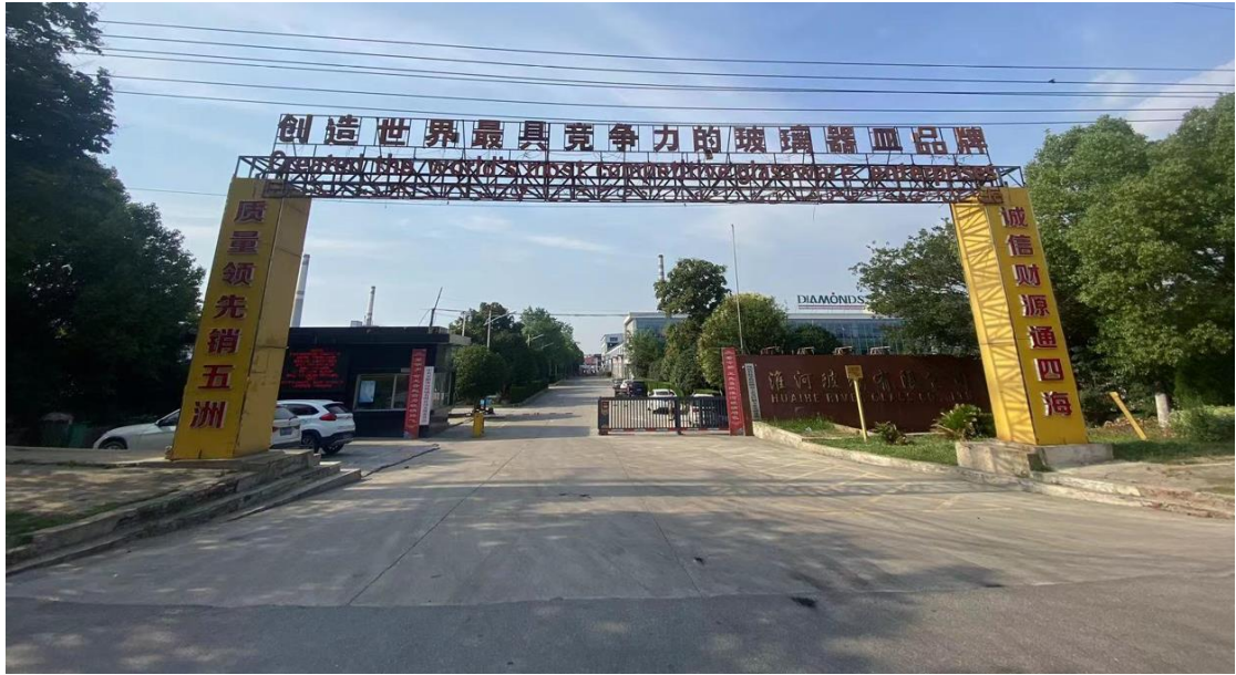
图 3-1 现场照片